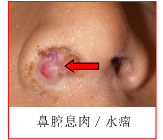
鼻腔息肉 / 水瘤

如不加以控制，过敏性鼻炎会严重损害生活质量素质，它会干扰您的睡眠，使您晨昏颠倒，影响您的学习能力与工作效率。再者，如没有治疗或不当的治疗，最终会引出其他并发症。这包括严重的全鼻窦炎，扁桃腺炎，增殖腺炎和分泌性中耳炎。鼻腔内的息肉也和过敏性鼻炎有密切的关系，虽然这种关连还不太清楚。